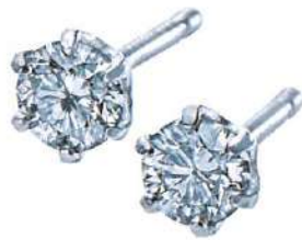
PTダイヤモンドピアス (トータルD-0.15ct) 通 11,000円(税込)▼