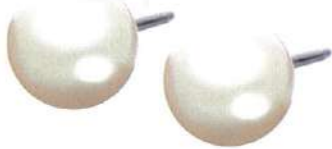
アコヤ真珠チタンピアス 通 3,300円(税込)▼