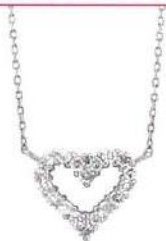
PTダイヤモンドネックレス (トータルD-0.30ct) 通 110,000円(税込)▼