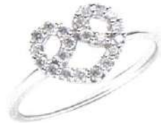
K18WGダイヤモンドリング (トータルD-0.20ct) 通 88,000円(税込)▼