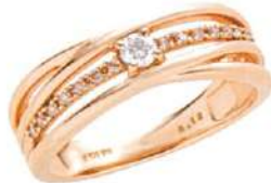
K18PGダイヤモンドリング (トータルD-0.10ct) 通 99,000円(税込)▼