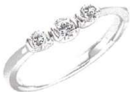
K18WGダイヤモンドリング (トータルD-0.30ct) 通 165,000円(税込)▼