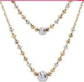
K18YG/K18WGネックレス 通 66,000円(税込)▼